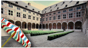
Cloître du Musée de la Vie wallonne Liège