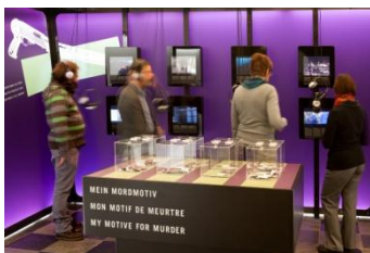
Crimes de sang. Une exposition sur la vie