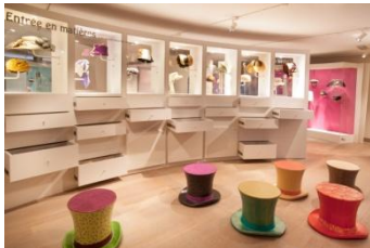
Une vie de chapeaux. Un chapeau pour chaque tête ?