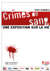
Visuel de l'exposition Crimes de sang. Une exposition sur la vie