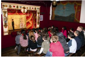
Théâtre de marionnettes