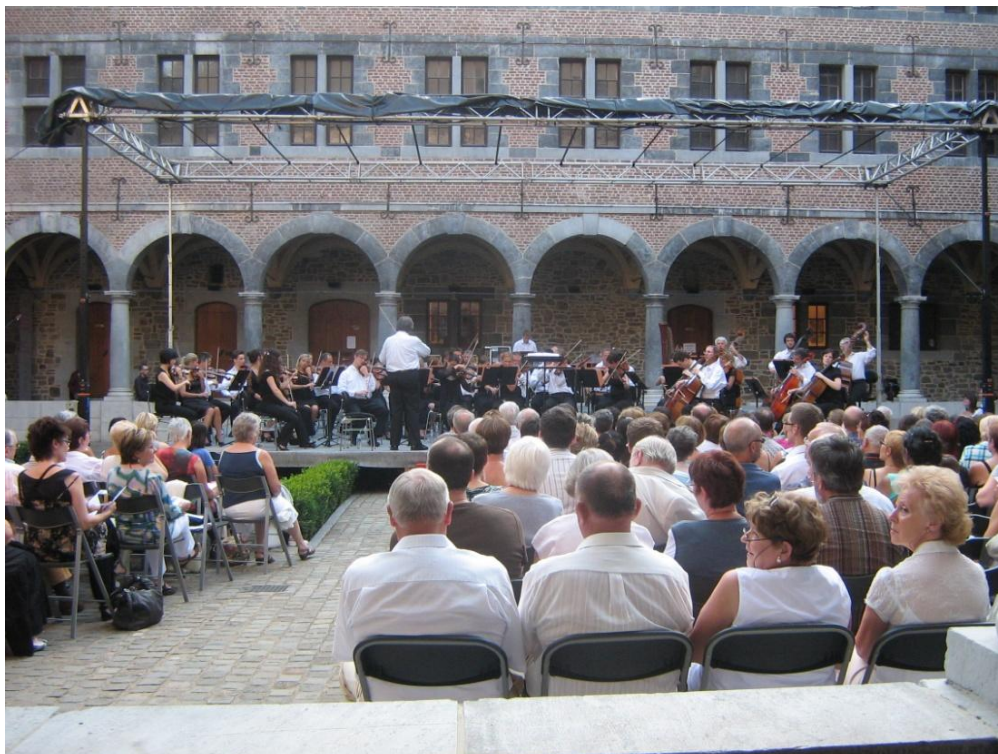
Concert de l'OPRL - juillet 2010.

Plus d'infos: www.oprl.be/concert-details/LOrchestre_lete_SAINTE_SAENS.html