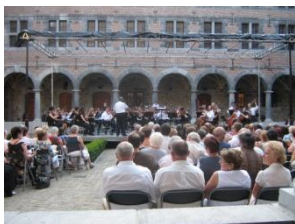
Concert Orchestre Philharmonique Royal de Liège, cloître du Musée, juillet 2010