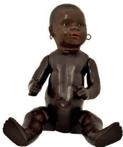
Poupée bébé africain, corps en composition (matière composite), tête est en biscuit coulé, yeux en verre, 54 cm, 1920-1930.

Elles comptent plus de 100.000 documents, sur supports papiers ou assimilés. Datant pour la plupart, des 19 e et 20 e siècles, ils présentent une grande variété de genre (affiches, cartes postales, chromos, tirés à part, images, photographies, publicités, etc.), de techniques (dessins, estampes, imprimés, manuscrits, etc.) et de formats. De nombreuses coupures de presse, appelées "petites enquêtes", constituent une mine de renseignements et complètent ce fonds, couvrant des domaines aussi variés que l'histoire, la vie économique, sociale, culturelle, politique, les dialectes, les arts, la littérature, les traditions et le folklore.