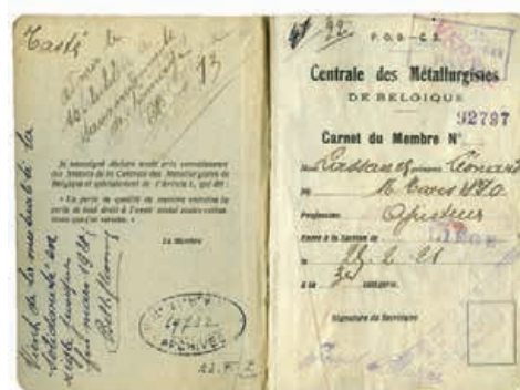
Carnet de membre de la Centrale des Métallurgistes de Belgique , Liège, 1921.

Collection du Musée de la Vie wallonne - acquisition 2012.