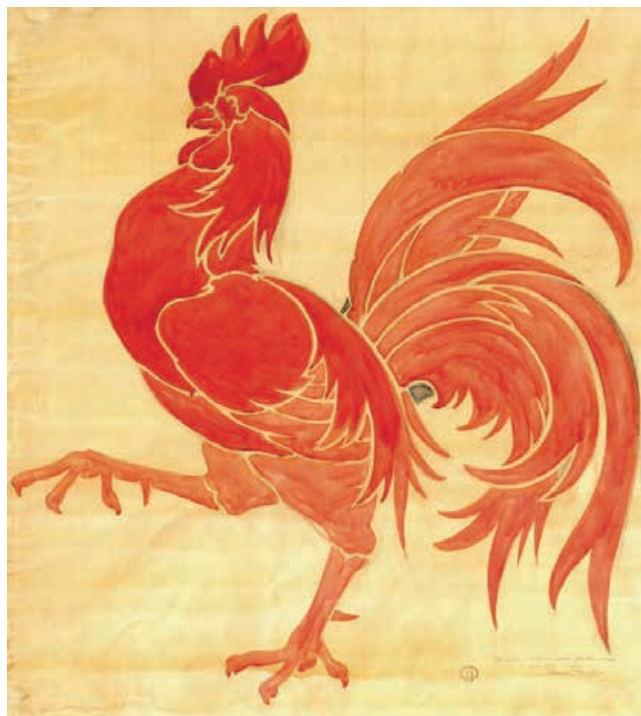
Dessin original (aquarelle) du coq wallon / Pierre Paulus, 1912. Collection du Musée de la Vie wallonne

Elle est une section spécialisée du Musée de la Vie wallonne. Elle réunit le fonds d'archives et de livres de la Société de Langue et de Littérature wallonnes et les collections du Fonds des dialectes wallons cédées à la Province par la Ville de Liège en 2005. La BDW, consacrée à la langue wallonne et à la littérature dialectale, est constituée de livres et tirés à part (35.000 ouvrages dont des dictionnaires, des atlas linguistiques, des études linguistiques et toponymiques, des œuvres littéraires, des manuscrits et des recueils de partitions musicales), de revues, journaux et almanachs (en tout 450 titres de périodiques), d'affiches, de documents audiovisuels et de dossiers documentaires sur les auteurs wallons, les associations dialectales ou tout autre sujet ayant trait aux langues régionales.