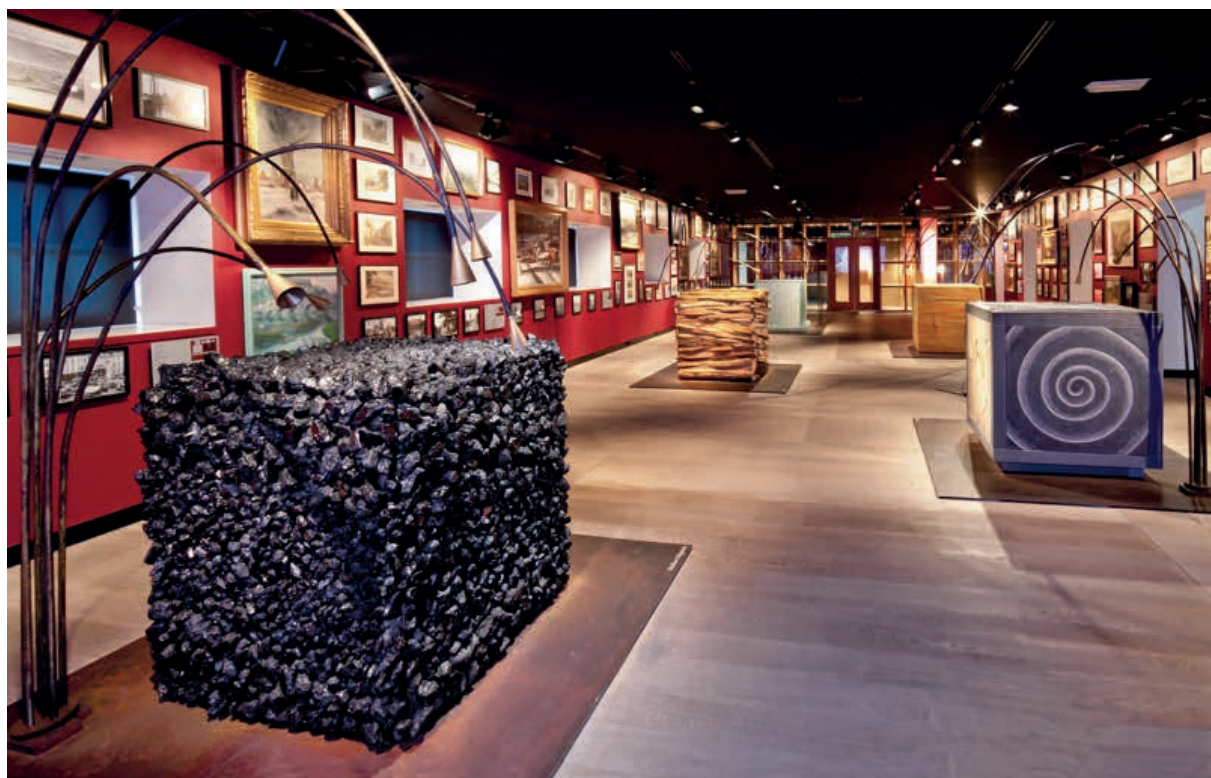
Wallonies(s), Espace « Découvertes », 2 e étage, Musée de la Vie wallonne.

Pour répondre aux besoins du Musée, un projet de nouvelles réserves conformes aux règles de conservation et de prévention est à l'étude. Le patrimoine provincial, collections du Musée et du château de Jehay sera rassemblé. La Province de Liège envisage le développement d'un Centre de Conservation et de Diffusion à rayonnement supracommunal.