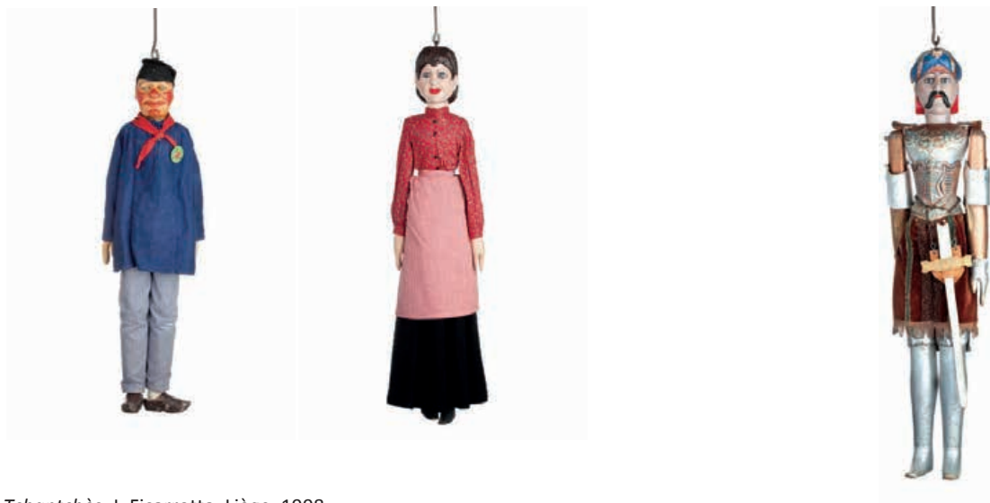
Tchantchès , J. Ficarrotta, Liège, 1998. Nanèsse , B. Pinet, Herstal, début 20 e s. Maure, F. Bouchat, Liège, début 20 e s.

Des séances publiques sont proposées les mercredis à 14h30 et les dimanches à 10h30. Sur réservation des séances privées peuvent également être organisées.