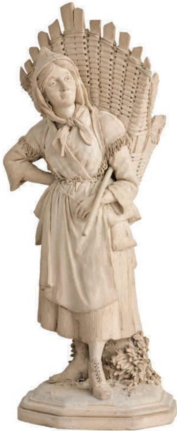
Botteresse par Léopold Harzé, Liège, vers 1860