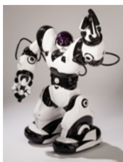
Robot interactif télécommandé Robosapien, WOW WEE, 2005.