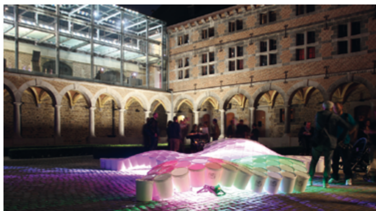
Cloître de nuit, Musée de la Vie wallonne.

LE MUSÉE DE LA VIE WALLONNE OFFRE AUSSI UNE RICHE PROGRAMMATION CULTURELLE TOUTE L'ANNÉE.