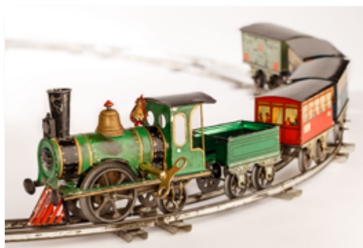
Train en métal lithographié composé d'une locomotive à vapeur, d'un tender à charbon, de quatre wagons, et de rails métalliques, fabriqué par la société JOHANN ANDREAS ISSMAYER (Allemagne/Nuremberg), fin 19e, début 20e siècles.

Les mercredis 23 et 30 décembre à 11 h 5 € - sur réservation