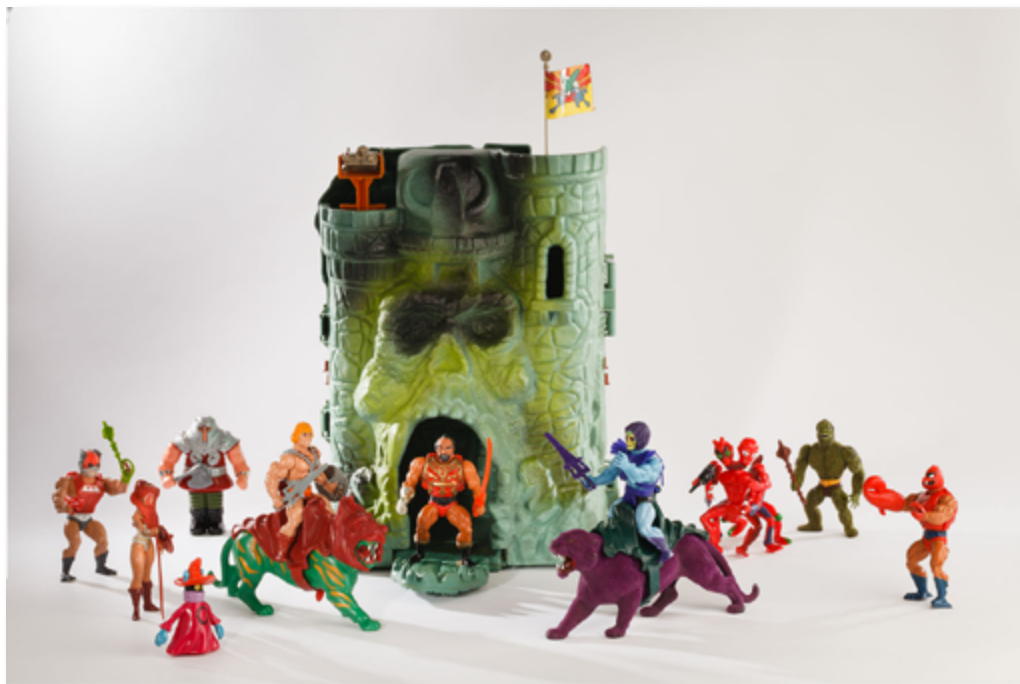
Figurines Les maîtres de l'Univers et forteresse Château des ombres , plastique, de marque Mattel, 1982, collection Retroludix asbl.

Quand les frontières entre la fiction et la réalité s'estompent, les mondes imaginaires gagnent du terrain ; une thématique privilégiée par de très nombreuses activités ludiques. Dès lors que l'enfant est un héros, la poupée qui le représente et à laquelle il s'identifie se doit de refléter force et puissance : un corps bodybuildé présentant des pectoraux hypertrophiés, expression d'une virilité affirmée et d'une toute-puissance indiscutable. Autant de diktats anatomiques irréalistes qui entretiennent une vision sexiste de la société.