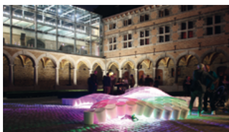
Cloître de nuit, Musée de la Vie wallonne.