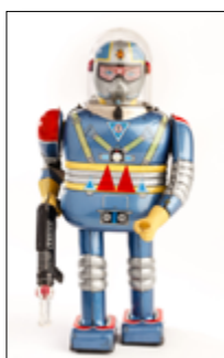
Robot Astronaut automatic actions, métal et plastique, de marque DAIYA (Japon), 1950-1960, Musée du Jouet de Ferrières.