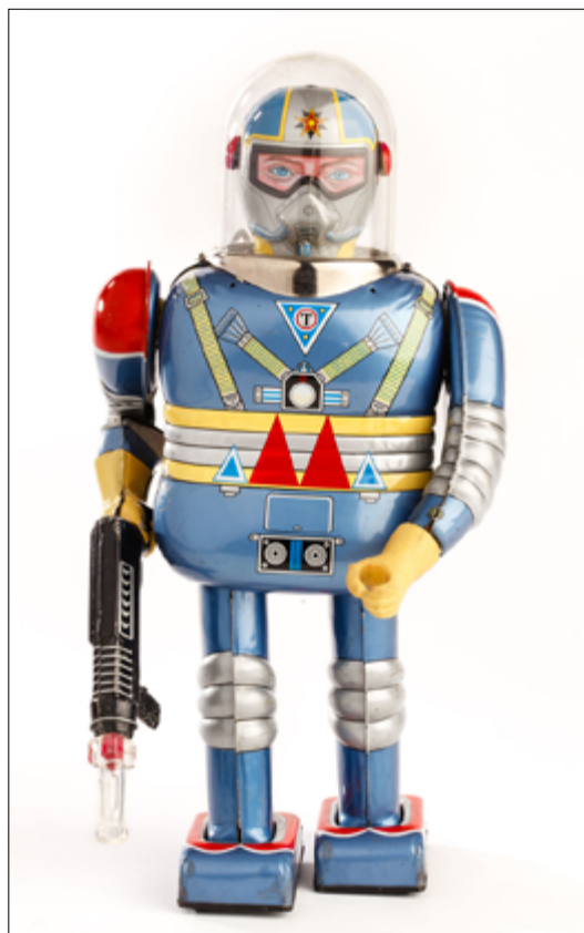
Robot Astronaut automatic actions, métal et plastique, de marque DAIYA (Japon), 1950-1960, Musée du Jouet de Ferrières.

Pour être dans le coup, il ne faut pas seulement rester jeune, mais aussi voir le monde avec des yeux d'enfant. Une philosophie qui répond, aujourd'hui, dans le monde occidental, à un besoin d'échapper à une réalité parfois difficile à supporter. Sous l'influence du design et de l'art contemporain, le jouet, jadis confiné dans la chambre de l'enfant, s'impose désormais, comme élément décoratif ou œuvre d'art, dans toutes les pièces d'habitation.