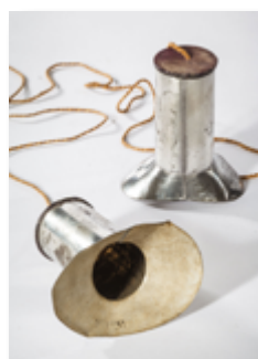
Téléphone fabriqué à l'aide de deux cornets en fer blanc reliés par une corde à une membrane qui vibre avec le son, 1900.