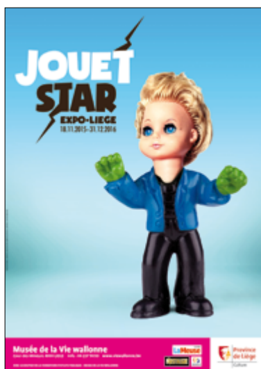
Visuel JOUET STAR 1 – Atroce

Le catalogue de l'exposition est disponible gratuitement sur présentation d'une carte de presse (prix de vente 10 €).