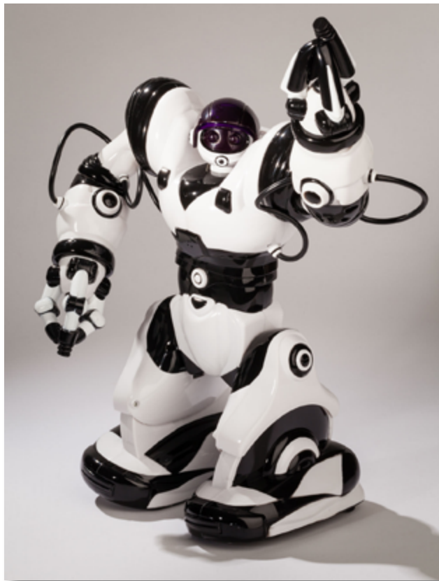
Robot interactif télécommandé Robosapien, WOW WEE, 2005.

Constituant la première industrie culturelle devant le cinéma, les jeux vidéo se généralisent dès la fin des années 1980. Leur influence va grandissante d'autant qu'ils s'imposent dans la vie de l'enfant à une période clé de son développement : la préadolescence. Mais quel est leur statut ? Ni jeux organisés selon des règles strictes, ni jouets d'invention stricto sensu, ils relèvent en fait des deux concepts. Les jeux vidéo vont engendrer bien des questionnements notamment sur l'addiction qu'ils génèrent et les valeurs qu'ils portent. Au centre de la polémique la confusion entre réel et virtuel, la violence et le passage à l'acte. Des interrogations qui reviennent périodiquement à l'occasion de faits divers sanglants.