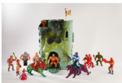
Figurines Les maîtres de l'Univers et forteresse Château des ombres, plastique, de marque Mattel, 1982, collection Retroludix asbl.