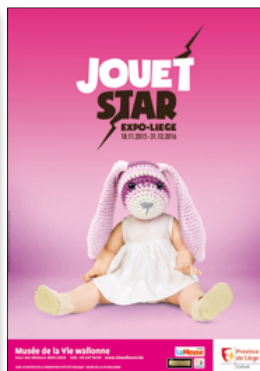
Visuel JOUET STAR 3 - La PetiteMiss