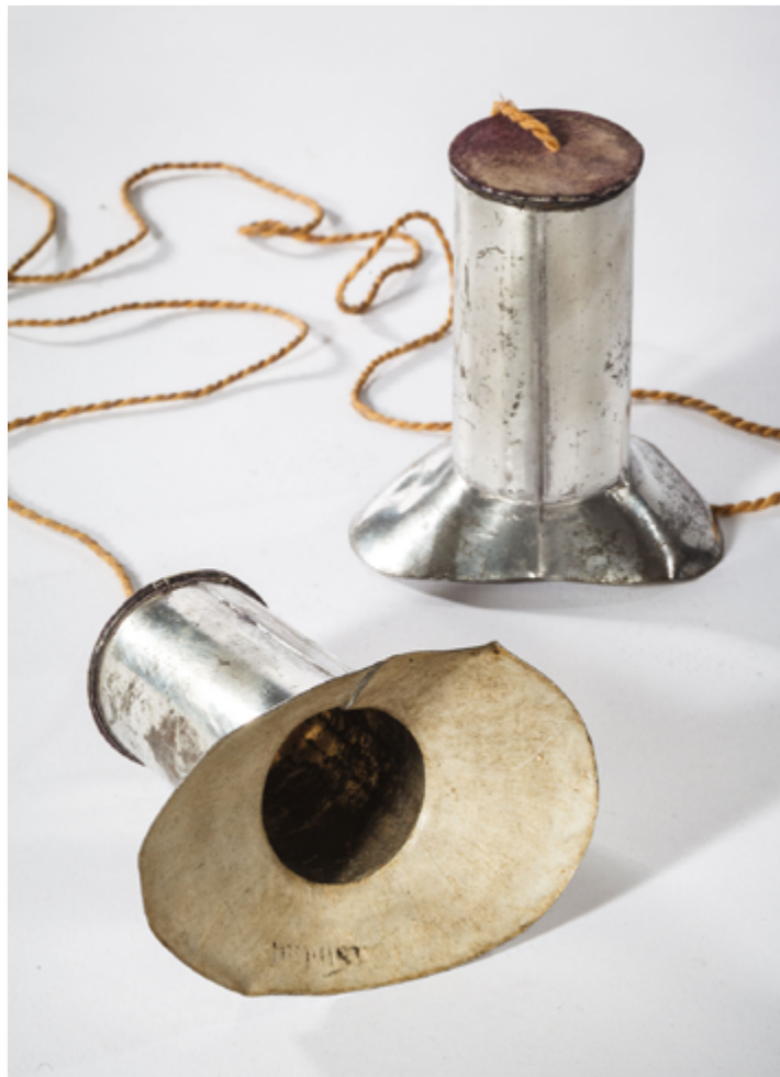
Téléphone fabriqué à l'aide de deux cornets en fer blanc reliés par une corde à une membrane qui vibre avec le son, 1900.

Néanmoins, quel adulte ne s'est pas étonné de voir un bambin se divertir plus avec l'emballage qu'avec le cadeau ? Un de ces matériaux auxquels l'enfant donne vie sans limite. Résultats d'une créativité spontanée, purs produits nés de l'imagination de leurs concepteurs, les objets bricolés par les enfants, à partir de simples éléments, bouts de bois et ficelles résistent mal au temps. Perdus ou désarticulés, remisés dans une armoire, ces trésors, sans valeur marchande, reprennent vie de temps à autre.