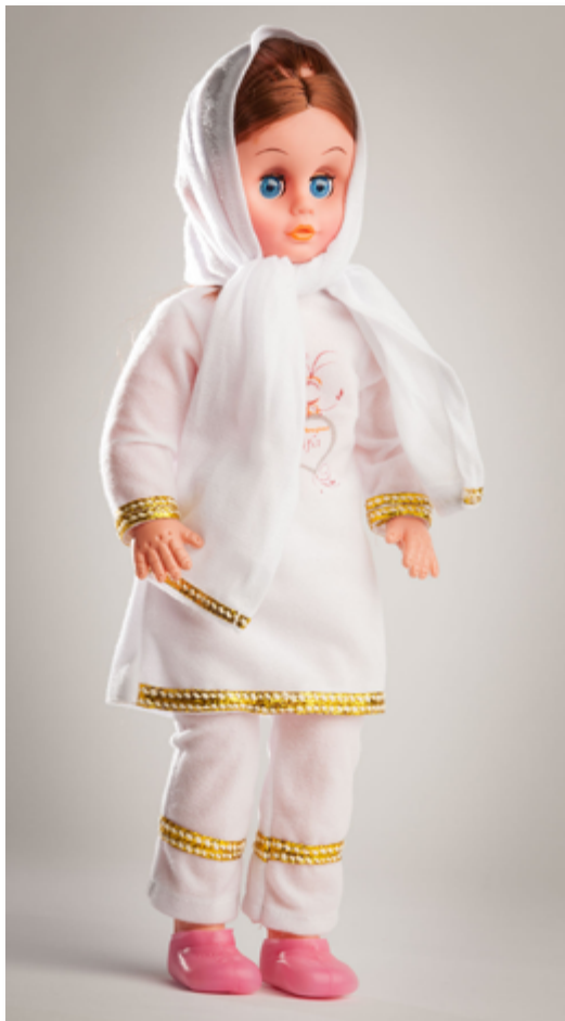
Poupée Chifa munie d'un dispositif sonore permettant l'apprentissage du Coran, plastique, produite par ORIENTICA PARIS, 2014.

L'étude des relations entre les jouets et les régimes autoritaires recèle d'insoupçonnées cohabitations. Plutôt que de constituer des uniques expressions serviles du pouvoir en place, les jouets en révèlent bien souvent les incohérences et les contradictions. Dans bien des cas, les jouets reflètent, en fait, une véritable diversité insoupçonnée de pratiques culturelles, éducatives et sociales.