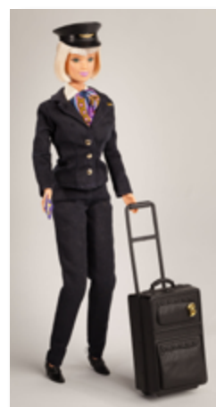
Poupée Barbie en tenue de pilote d'avion, vinyle et plastique, de marque MATTTEL, vers 2000. Dans les années '60, Barbie était représentée dans le rôle de l'hôtesse de l'air.