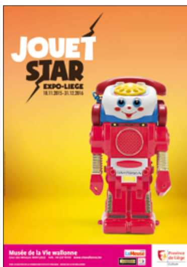
Visuel JOUET STAR 2 - Bollos