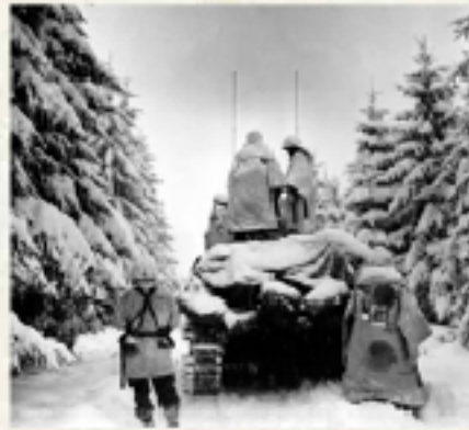
Conditions extrêmes autour de Bastogne

unter absoluter Geheimhaltung angeordnet hat. „Sie werden Antwerpen zurückerobern“, sagt er zu seinen sprachlosen Generälen.