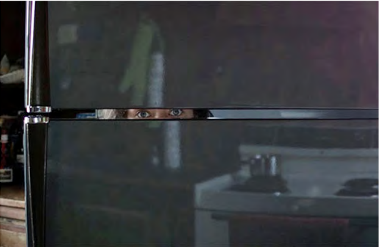
Charlotte Lagro, The Art-Shaped hole in my heart , 2015, Full HD Video 00:11:39