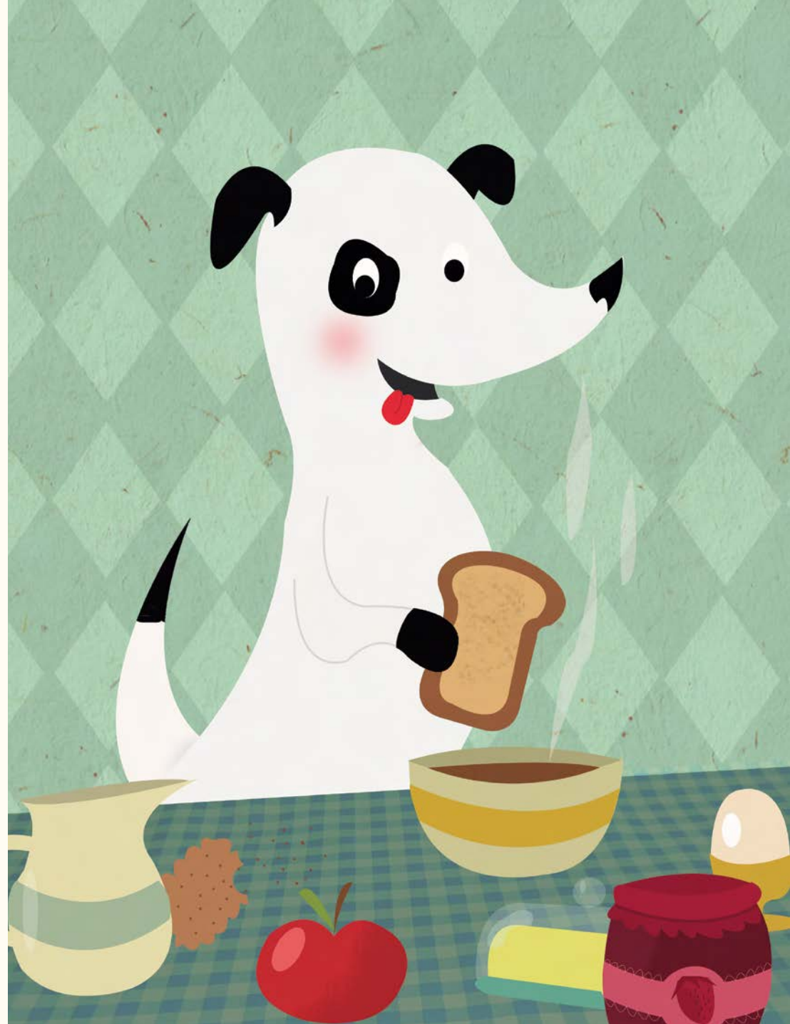
Illustration de Séverine Maingard

Tâis-toi, toi, Toutou, tu as tort ! Tu trempes toujours tes tartines toutes entières tout le temps.