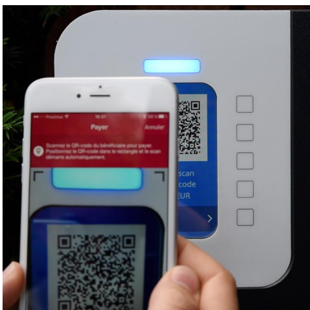
Ecran avec QR code pour paiement Bancontact

Le paiement est effectué et la recharge peut alors commencer.