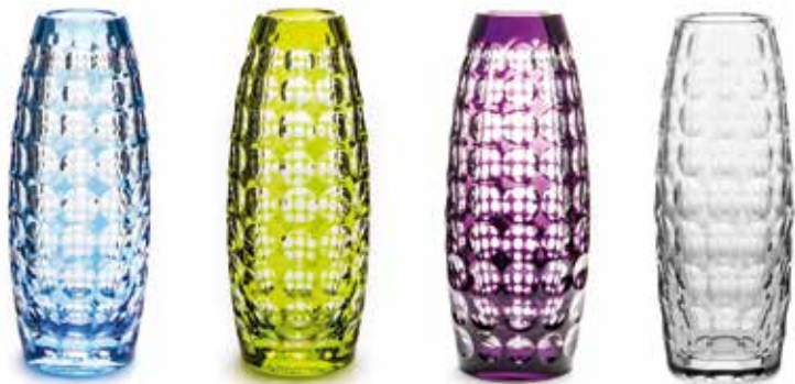
Collection Kaléido ©Val Saint-Lambert