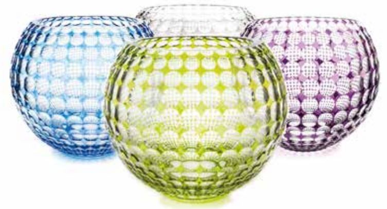
Collection Kaléido ©Val Saint-Lambert