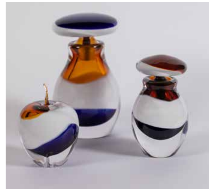
Nouvelle collection Val Saint-Lambert