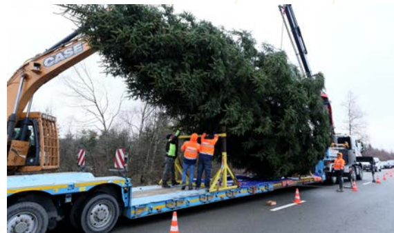
Transport du sapin royal

Cette année, c'était au tour de la Province de Liège d'offrir l'arbre de Noël : un sapin parfaitement garni et sans défaut de port ni de tête, sélectionné par la Province de Liège, avec l'appui de la Division Nature et Forêts, à Xhoffraix, sur le territoire de la Commune de Malmedy.