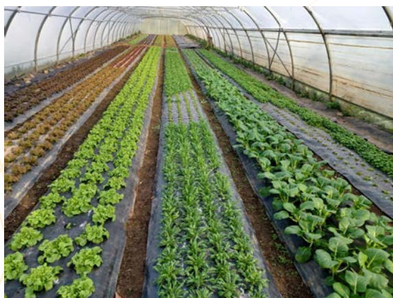
Cultures maraîchères sous serre

80 exploitations maraîchères , correspondant à environ 160 maraîchers , ont bénéficié de conseils pour l'élaboration des plans de culture, la préparation du sol, les techniques de plantation, la lutte contre les adventices et les ravageurs, etc.