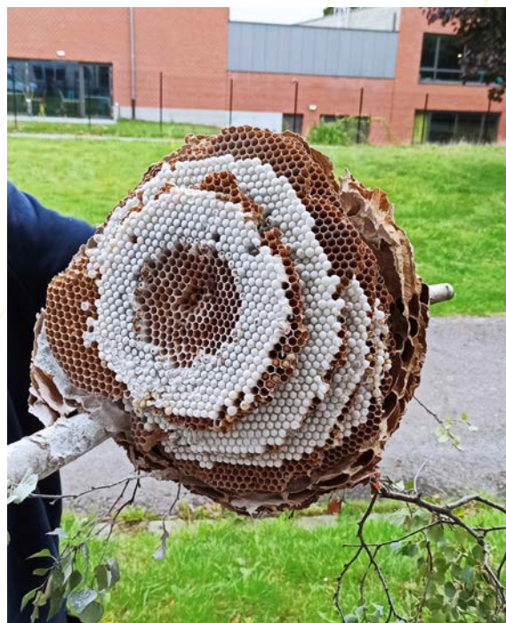
Nid découvert (après neutralisation)

Le Villes et Communes , les élus, les mandataires locaux et le grand public ont pu participer à des conférences sur les enjeux liés au frelon asiatique, son identification et les comportements à adopter lors de sa présence.