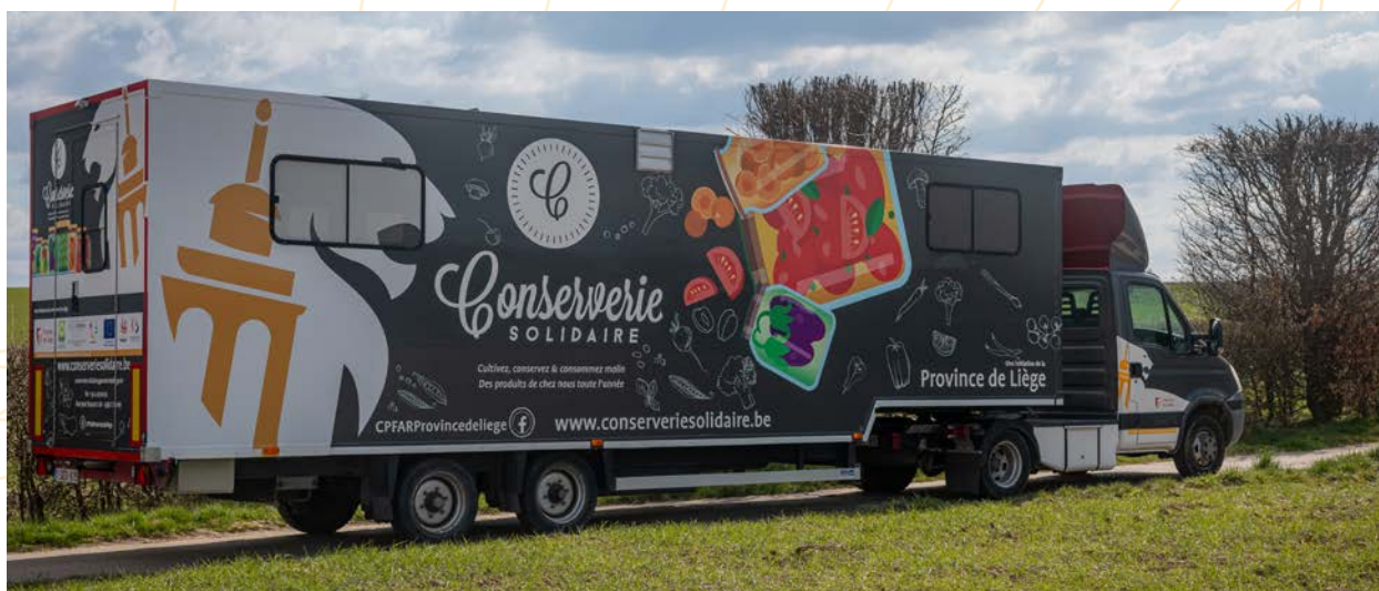
Flocage du camion de la conserverie solidaire

En 2025, plusieurs aménagements ont été réalisés : création d'un potager pédagogique lié à la formation du même nom, installation de bacs à plantes aromatiques , mise en place d'une « ruche cheminée » permettant l'observation sécurisée du monde des abeilles, etc.