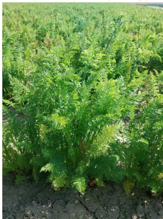
Parcelle de carottes

CPL-Végémar ASBL participe à plusieurs réseaux d' avertissements généralisés (froment, betterave, etc.) qui informent les agriculteurs du risque de la présence de ravageurs et maladies dans leurs parcelles.