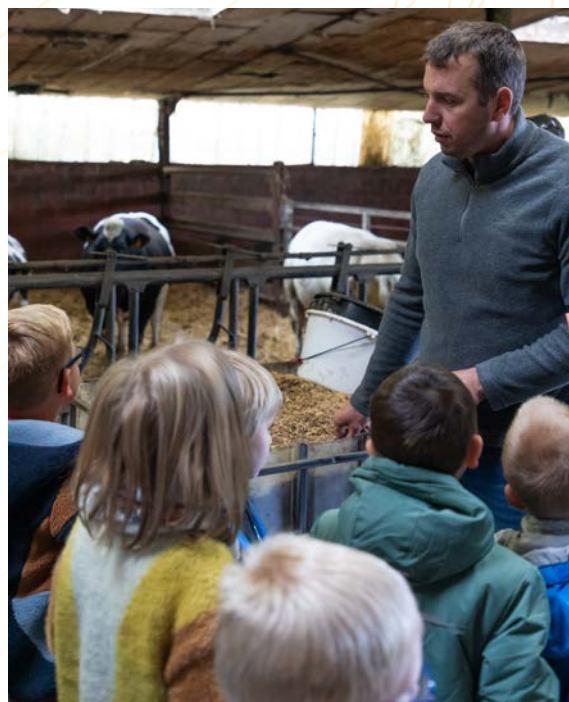
Une journée des enfants à la ferme