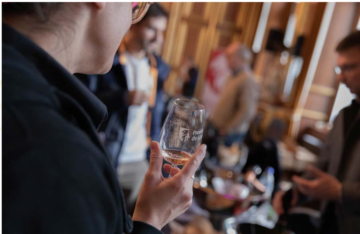
2 e Salon des viticulteurs au Palais provincial

Deux formations techniques destinées aux viticulteurs et une activité pédagogique ont été prévues afin de renforcer les compétences en viticulture durable et sensibiliser aux métiers.