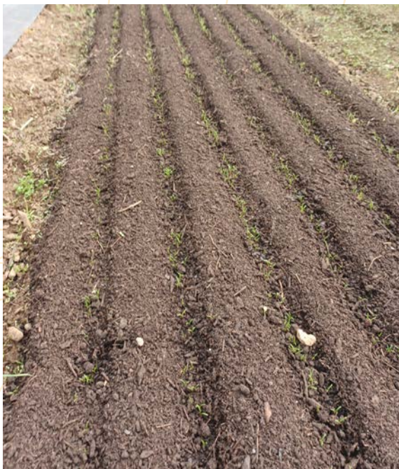
Nouvelle technique de semis de carottes

Les attaques de punaises ont été particulièrement importantes sur les cultures menées en serre . Elles ont causé des dégâts notables aux tomates, aubergines, poivrons et concombres.