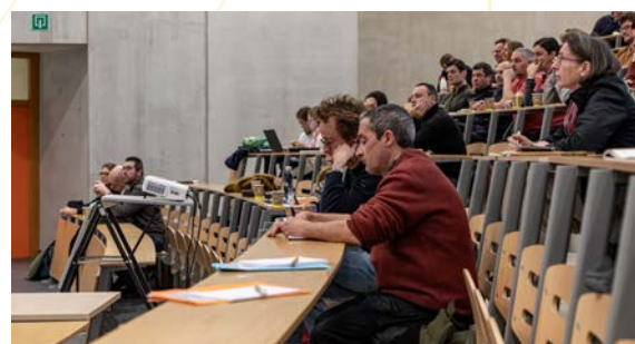
Journée des maraîchers bio

Une des interventions a concerné la santé mentale et physique des maraîchers, les participants ont ainsi été sensibilisés à l'importance de ces aspects pour la pérennité de leurs projets.