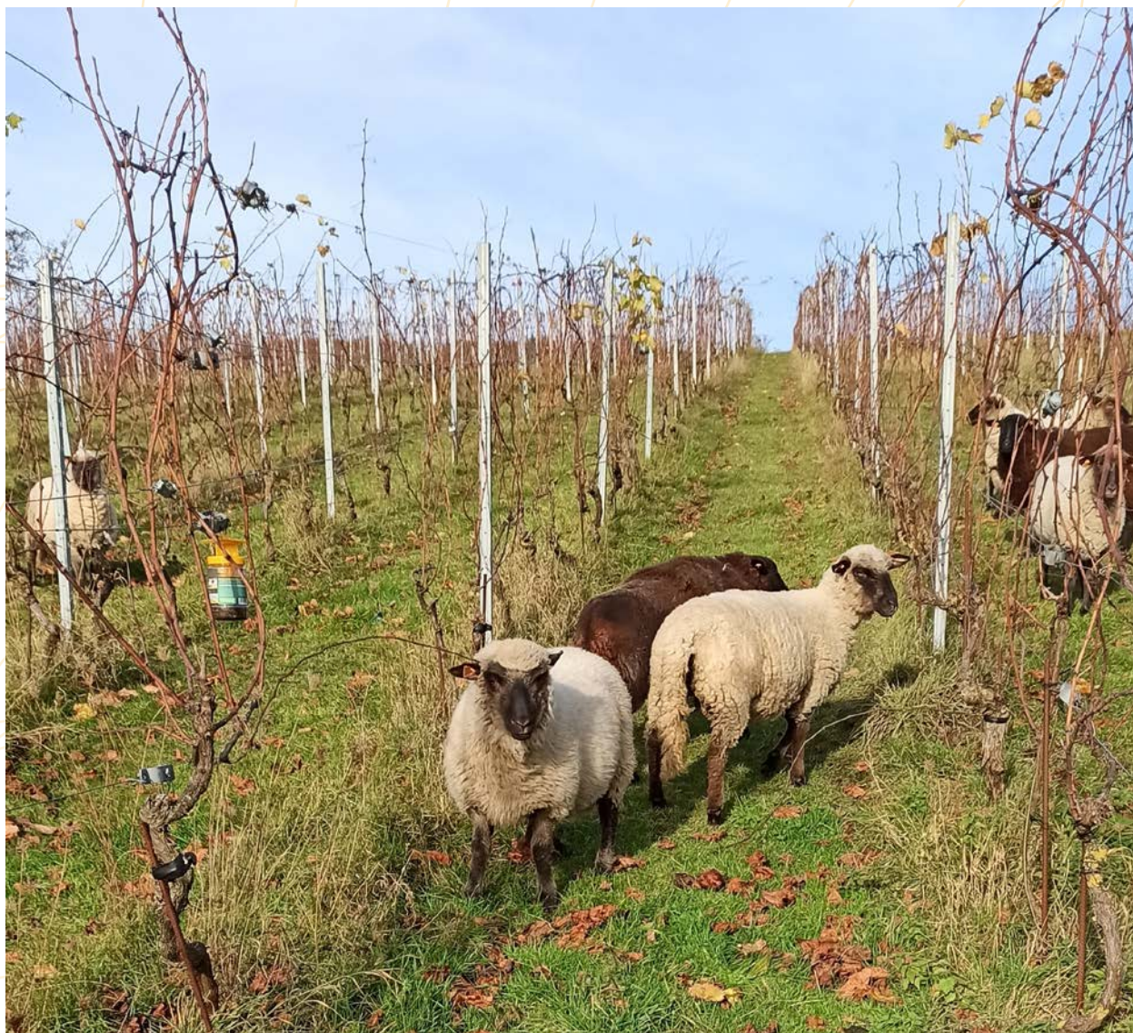
Gestion du vignoble par éco-pâturage