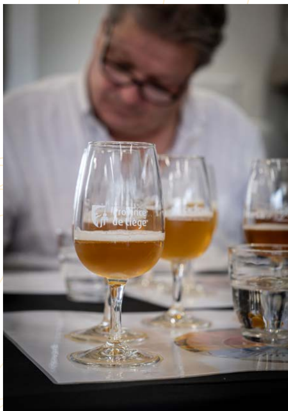
Concours des bières de la Province de Liège au CPFAR – 7 e édition

Les 4 critères analysés lors de la dégustation sont l' ap- parence (couleur de la mousse et de la robe, pétillance, caractéristiques de la robe), les arômes du nez (fleurs, fruits, épices, lactique, levures), la bouche et le corps (caractéristiques générales, corps de la bière, arrière- goût, erreurs) et les qualités techniques (absence de défauts, équilibre, plaisir).