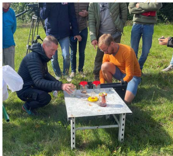
Atelier de géolocalisation des nids

La lutte contre le frelon asiatique a constitué l'un des enjeux majeurs du cycle Miel et Abeilles 2025.