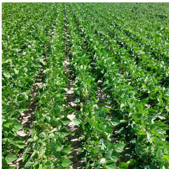
Parcelle de haricots

Les avertissements agricoles sont de véritables outils d'aide à la décision en agriculture, ils permettent de réduire l'utilisation de moyens de lutte contre les ravageurs et les maladies.