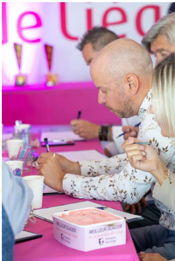
Finale du Concours

Le public était invité à choisir le parfum de la glace à produire par les finalistes du concours, aux côtés du sorbet à la fraise , imposé pour cette édition. C'est le parfum pistache qui a été plébiscité !