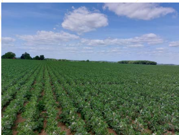
Essai de désherbage en culture de fève