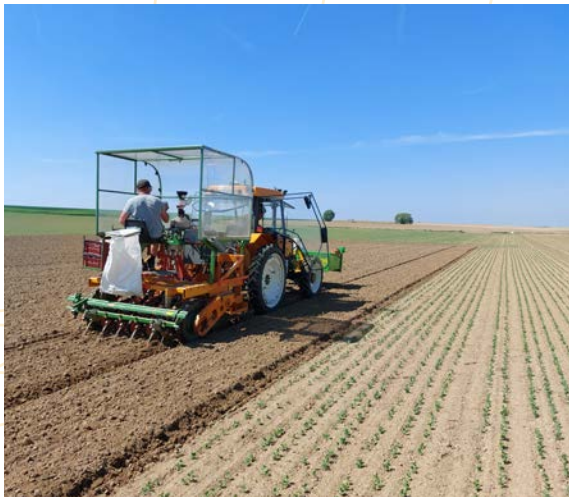
Mise en place d'un essai

Chaque objet est répété au moins 3 fois dans un essai pour pouvoir faire une analyse statistique fiable des résultats obtenus.