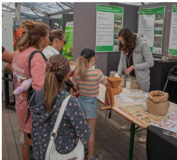
Foire agricole de Battice 2025

En plus des organisations spécifiques, comme les « Soirées à la ferme », des producteurs locaux ont pu mettre leurs savoir-faire en évidence :