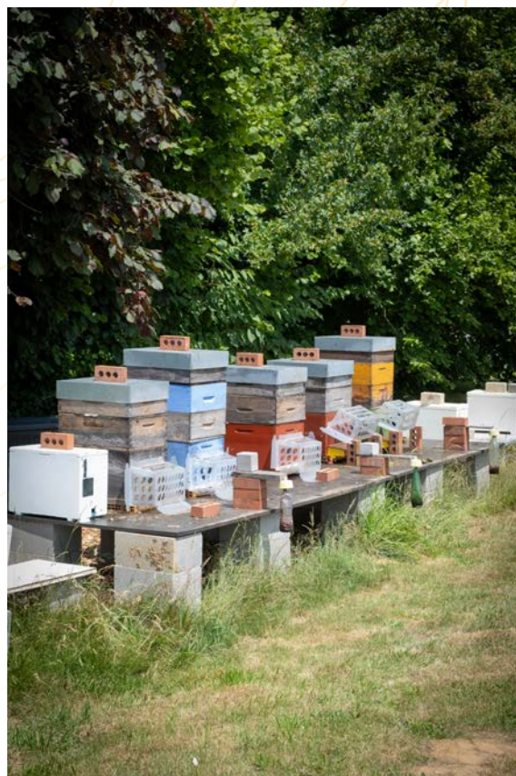
Rucher didactique de Crisnée

Les ruches du CPFAR sont équipées de différents types de muselières et de pièges à frelons asiatiques . L'évaluation des résultats obtenus est partagée avec le secteur apicole et contribue à l'amélioration des pratiques et outils de lutte.