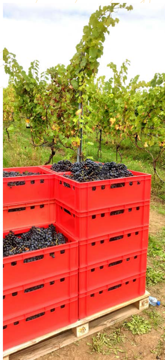
Vendange 2025 du vignoble pédagogique provincial

Ce vignoble est un support unique pour l'organisation de formations et de stages.