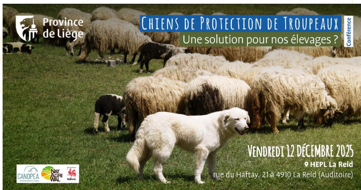
Chiens de protection de troupeaux