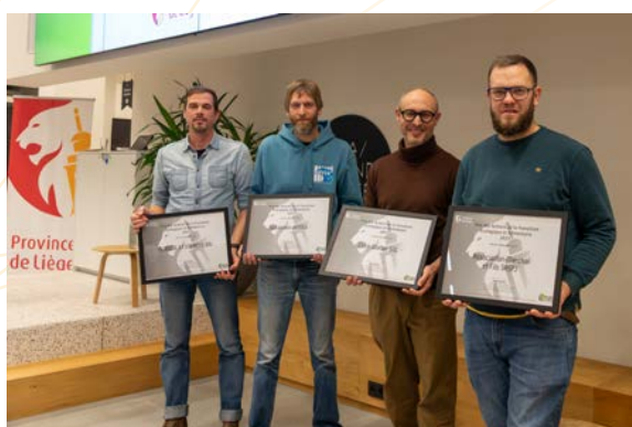
Plan Climat – Colloque « La robustesse des territoires » et remise des prix « PATEA »

54 dossiers de candidature ont été reçus pour la 5 e édition du Prix des Acteurs de la Transition Écologique et Alimentaire de la Province de Liège.