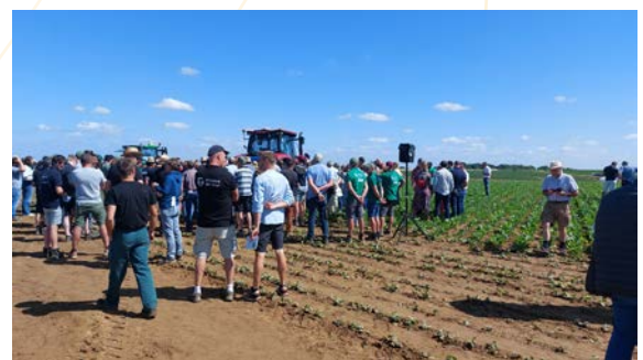
Visite commentée d'une parcelle d'essai

Plus de 40 exposants des secteurs privé et public (agro-fourriture, machines agricoles, structures d'encadrement, organisme certificateur, etc.) et 600 visiteurs ont participé à l'évènement.