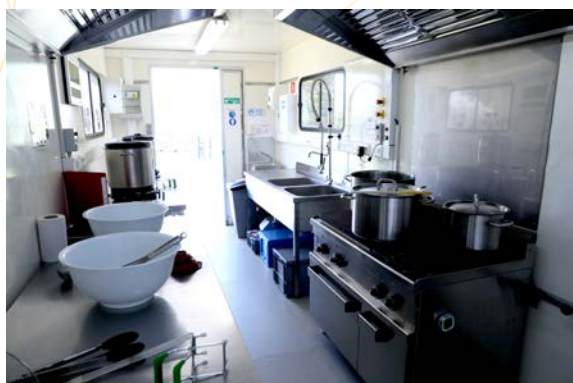
10 ans de la Conserverie Solidaire et Itinérante du CPFAR

Ce projet est soutenu par des financements européens depuis 2015, pour la période 2022-2025, le Fonds Social Européen a octroyé un subside de 471.572,00 € .