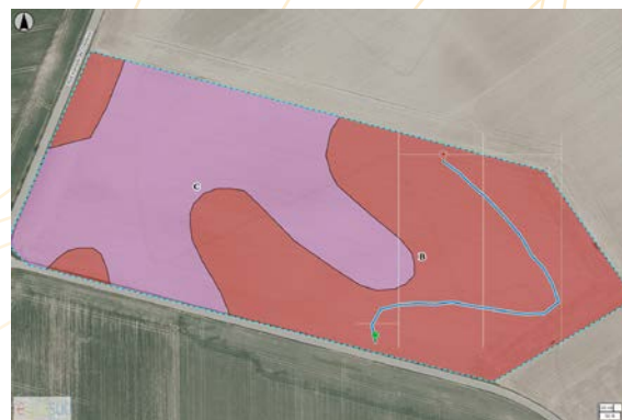
Cartographie d'une parcelle et des prélèvements réalisés via le portail REQUACARTO

11.000 prélèvements d'échantillons agricoles ont été réalisés au bénéfice de plus de 900 agriculteurs .