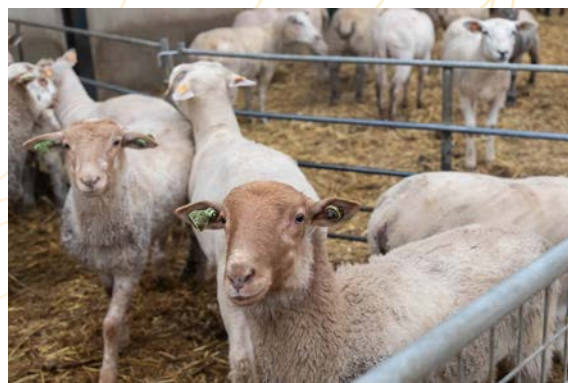
Eco pâturages – Gestion écologique des talus et prairies par les moutons