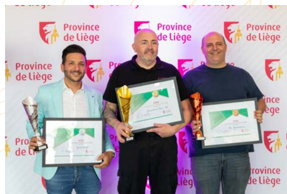
Lauréats du Concours

La finale a eu lieu le 20 mai 2025 à Waremme, au Province Ballons Arena. Un jury aguerrri, composé notamment de professionnels de l'HoReCa, a déterminé les 3 lauréats du concours parmi les 10 finalistes . Les résultats sont présentés en annexe 8.