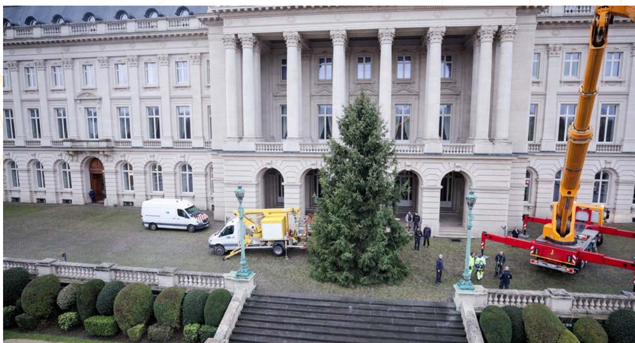
Bruxelles - Arrivée du sapin au Palais Royal