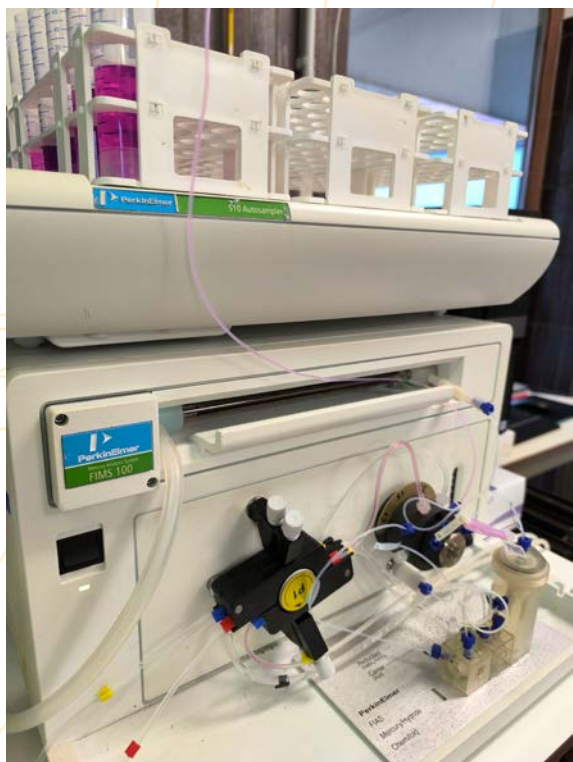
Dosage du mercure

L'appareil de dosage du mercure par la méthode Flow Injection Mercury Systems est opérationnel, à Tinlot, depuis le mois d'octobre 2025.