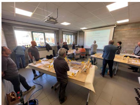
Atelier de fabrication de muselières de protection contre les frelons asiatiques

Le programme de ces conférences apicoles est présenté en annexe 5.