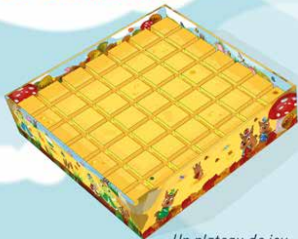
Un plateau de jeu.