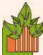
Plate-Forme Sortants de Prisons – Asbl

BP 101 4000 Liège 04/2303166 Courriel : pfsp.liege@yahoo.fr