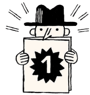
Éric Fottorino Korsakov