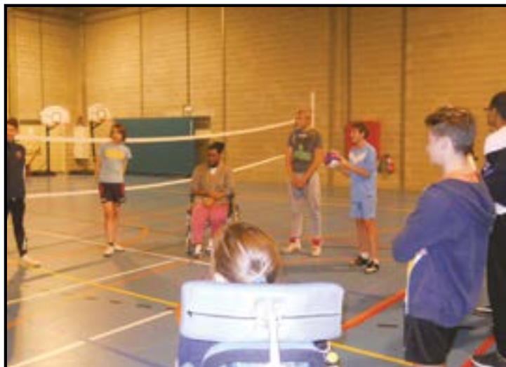
Echauffement avant une partie de net volley lors de la journée sportive consacrée au sport adapté

Pour la 4 e édition de la marche ADEPS organisée par l'IPES Seraing, pas moins de 490 marcheurs ont foulé les sentiers des bois du Sart-Tilman le 11 octobre dernier. Outre la qualité du parcours et du fléchage, les nombreux participants ont tenu à souligner l'accueil chaleureux qui leur a été réservé sur le site d'Ougrée.