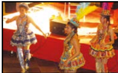
Escale péruvienne au Campus 2000 p.7