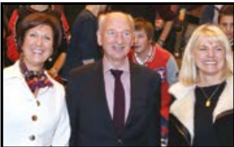
Visite de Dirk Frimout à l'EP Seraing p.3