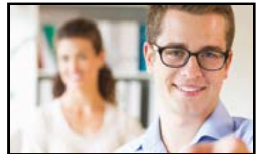
Formations continues 2016. p.10