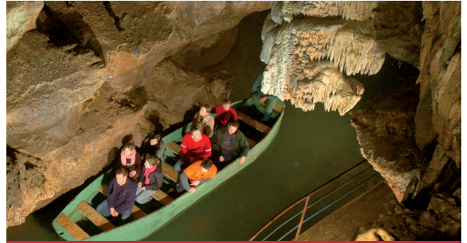
Grottes de Remouchamps