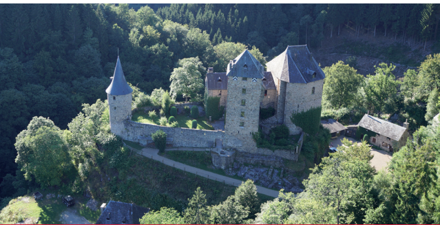
Château de Reinhardstein