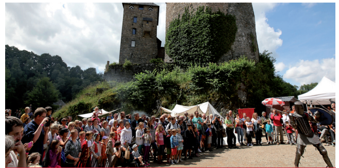
Château de Reinhardstein