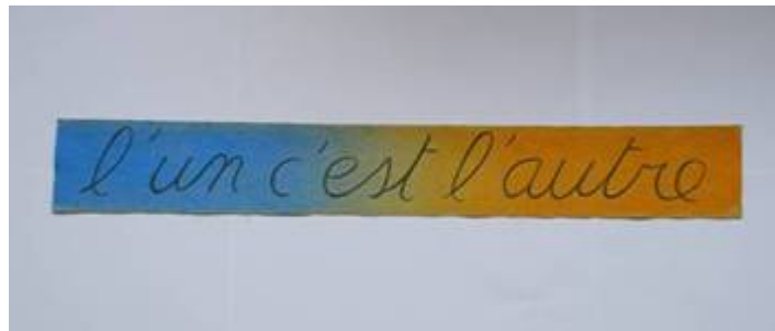
Avant-projet de l'œuvre - © C. Mewissen

L'œuvre, par son caractère polysémique, garantit une liberté d'interprétation. Il la commente en ces termes :