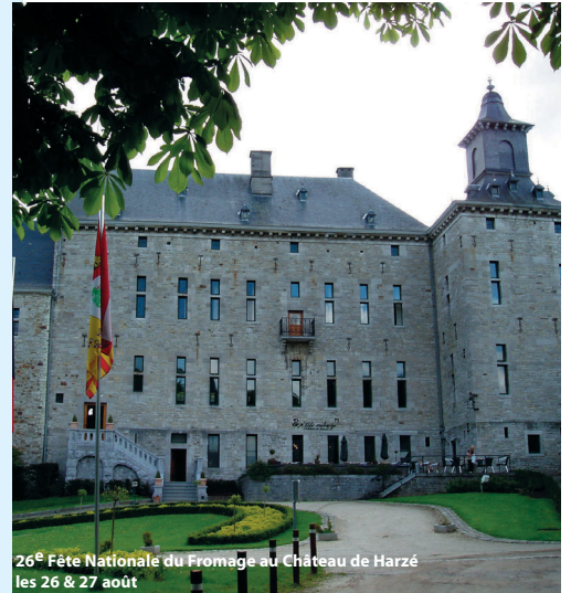
26 e Fête Nationale du Fromage au Château de Harzé les 26 & 27 août

MARCHE ADEPS : 5, 10, 15 et 20 km pour découvrir