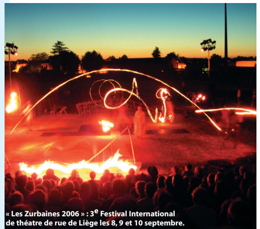
« Les Zurbaines 2006 » : 3 e Festival International de théâtre de rue de Liège les 8, 9 et 10 septembre.

Le plus parisien des théâtres liégeois, le plus liégeois des théâtres parisiens... A (re)découvrir !