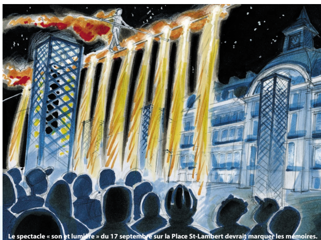
Le spectacle « son et lumière » du 17 septembre sur la Place St-Lambert devrait marquer les mémoires.

La cuvée 2005 du week-end en Cité ardente coïncidera en effet avec le lancement officiel de l'opération « De Saint Lambert... au Pays de Liège » et ce, par le biais d'un grand spectacle associant à la fois « son et lumière », théâtre de rue, effets pyrotechniques, funambules... D'accès gratuit pour le public, il marquera à coup sûr les mémoires. Ce grand rendez-vous est fixé sur la place Saint-Lambert le samedi 17 septembre à 22h15, pour une grande fresque historique