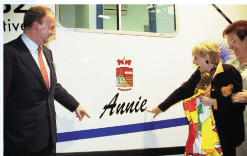
Annie Cordy découvre le Mammobile dont elle est la marraine

On ne peut plus ignorer cette maladie qui touche plus de six mille femmes chaque année. Une femme sur onze sera au cours de sa vie confrontée au cancer du sein ! C'est le cancer le plus fréquent chez la femme. Il tue environ 2500 femmes par an. Des moyens