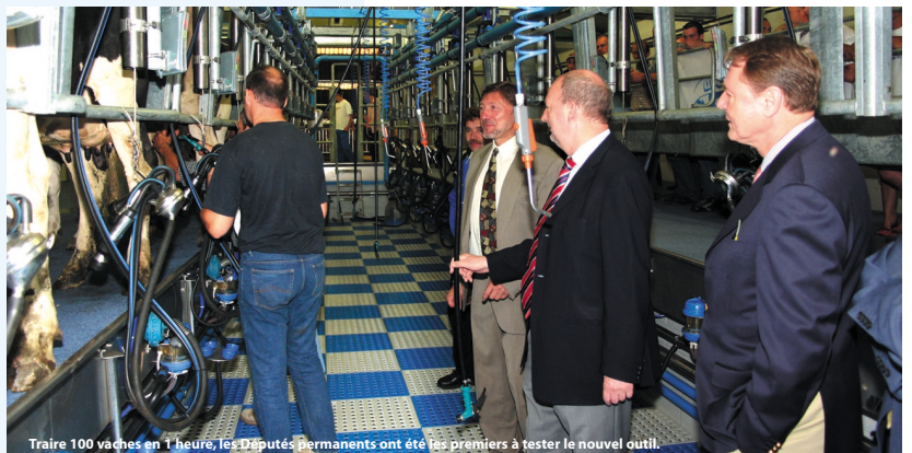
Traire 100 vaches en 1 heure, les Députés permanents ont été les premiers à tester le nouvel outil.