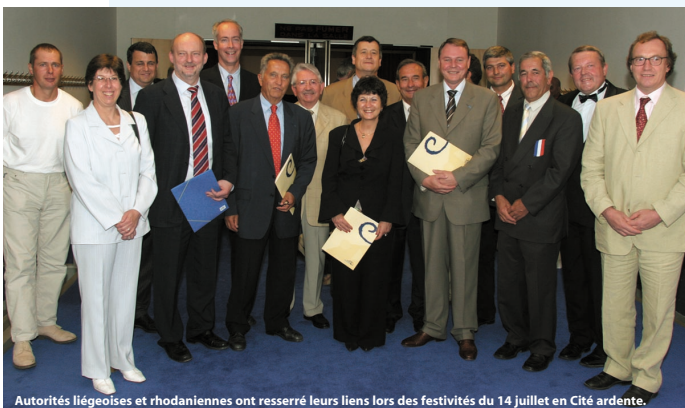
Autorités liégeoises et rhodaniennes ont resserré leurs liens lors des festivités du 14 juillet en Cité ardente.

Infos : Domaine provincial de Wégimont au 04/ 377 99 00 ou www.prov-liege.be/wegimont