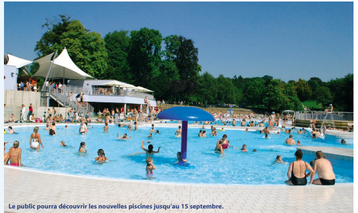
Le public pourra découvrir les nouvelles piscines jusqu'au 15 septembre.

lonne — ont permis de remplacer les anciennes infrastructures. Une réelle performance accomplie par la firme Galère de Chaudfontaine et le bureau Sixco de Liège pour la coordination de chantier.